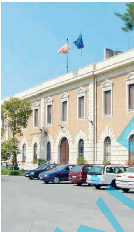
Plesso "San Pietro" in fase dibattimentale il processo per i favoritismi in carcere